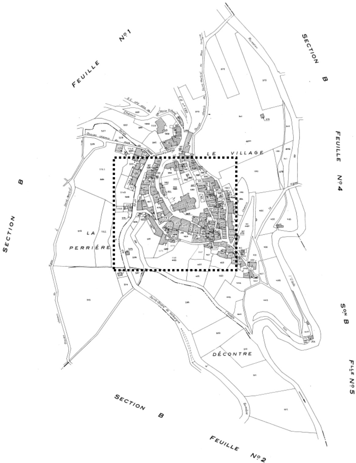
Annexe 1 Localisation du parcours proposé par le CAUE (mars 2007)