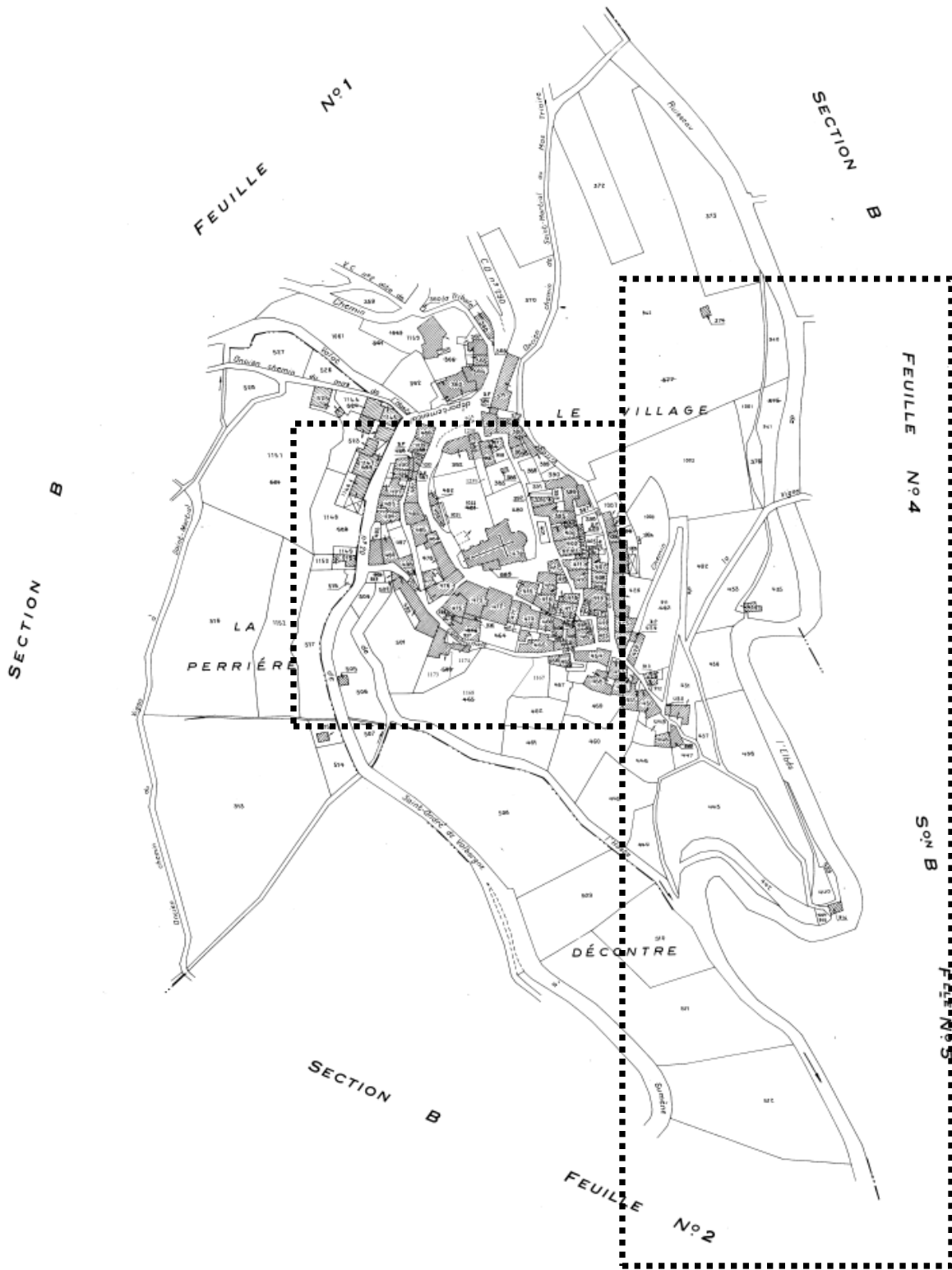
Annexe 2 : Localisation de l'extension du parcours proposé (septembre 2008)